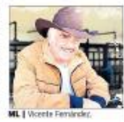
Vicente Fernández.

México | Notistarz | El cantante mexicano Vicente Fernández muestra un favorable progreso en su salud, luego de que este fin de semana le fuera practicada una traqueotomía de la cual salió bien y sin incidentes, informaron fuentes familiares.