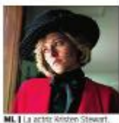
La actriz Kristen Stewart.

El filme sigue a la Lady Diana mientras pasa vacaciones de Navidad con la familia real en Sandringham y decide dejar su matrimonio con Carlos.