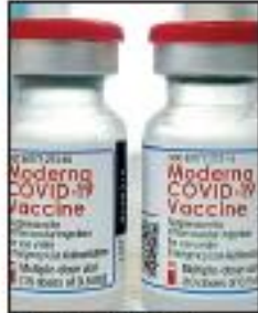
AFP | Dosis de Moderna.

AFP | Las autoridades sanitarias de México aprobaron la vacuna contra la covid-19 de la farmacéutica estadounidense Moderna y en próximos días se espera la llegada de 3,5 millones de dosis del antídoto, se informó oficialmente ayer. La Comisión Federal para la Protección contra Riesgos Sanitarios (Cofepris), anunció en un comunicado que se "ha dictaminado procedente la autorización para uso de emergencia de la vacuna Moderna". México ya había aprobado otras siete vacunas: Pfizer, AstraZeneca, CanSino, Sputnik V, Sinovac, Covavax y Janssen.