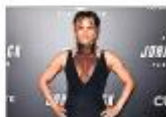
Actriz Halle Berry.

El rapero ha hecho cameos en series; la de BMF se estrena el 26 de septiembre en Starz.