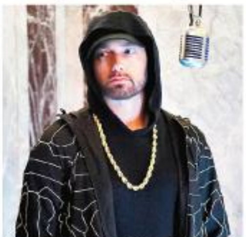
El rapero estadounidense Marshall Mathers II, Eminem.

la ciudad natal de Eminem, el último drama de Starz del productor de Power Universe, 50 Cent, cuenta la historia real de dos hermanos de Detroit, Demetrius "Big Meech" Flenory (Demetrius "Lil Meech" Flenory Jr.) y Terry "Southwest T" Flenory (Da'Vinchi), que pasaron de ser comerciantes de poca monta a fundadores de una de las familias criminales más poderosas del país.