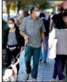
AFP | Ciudadanos en Chile.

AFP | El gobierno de Chile anunció ayer que por primera vez desde marzo 2020 ninguna región ni comuna deberá cumplir cuarentena, en momentos que más de 80% de la población objetivo, 15,2 de los 19 millones de habitantes, están inmunizados contra la covid-19. Aunque las autoridades temen una nueva ola debido a la expansión de la variante Delta en otras partes del mundo, la decisión se basa en la caída de las cifras de contagios, fallecidos y positividad, las más bajas desde el inicio de la pandemia de Covid-19, acontecidos del año pasado.