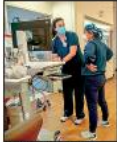
AFP | Hospital en Luisiana.

AFP | En la Unidad de Cuidados Intensivos del Hospital North Oaks de Hammond, Luisiana, detrás de los respiradores artificiales, los rostros de los pacientes lucen grises y demacrados, consumidos por el covid-19. Como en el resto de centros de salud del estado, sus instalaciones están volcadas a atender víctimas de la pandemia. De sus 330 camas, 81 están ocupadas por pacientes con coronavirus, la mitad de los cuales se encuentran en estado crítico. El sur de Estados Unidos ahora está en jaque por la ola que propició la variante delta del virus.