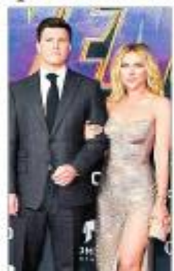
Colin Hanks y Johansson.

ML | Colin Hanks confirmó que su esposa Scarlett Johansson está embarazada. El comediante de SNL, de 39 años, estaba haciendo un espectáculo de stand-up en un teatro en Connecticut cuando mencionó a su próximo bebé con la actriz.