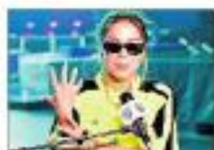
La cantante Berry.

ML | Halle Berry es demandada por la exluchadora de UFC Cat Zingano, por su nueva cinta "Bruised", alega engañarla y hacerla perder contratos.